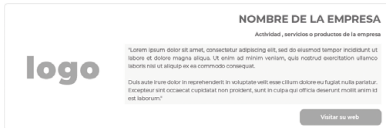
(Ejemplo tarjeta permanente)

En el apartado de “socios industriales” la empresa implicada tendrá un lugar permanente con una tarjeta de presentación y datos de actividad de la marca, así como un botón de llamada a la acción de visita a su web.