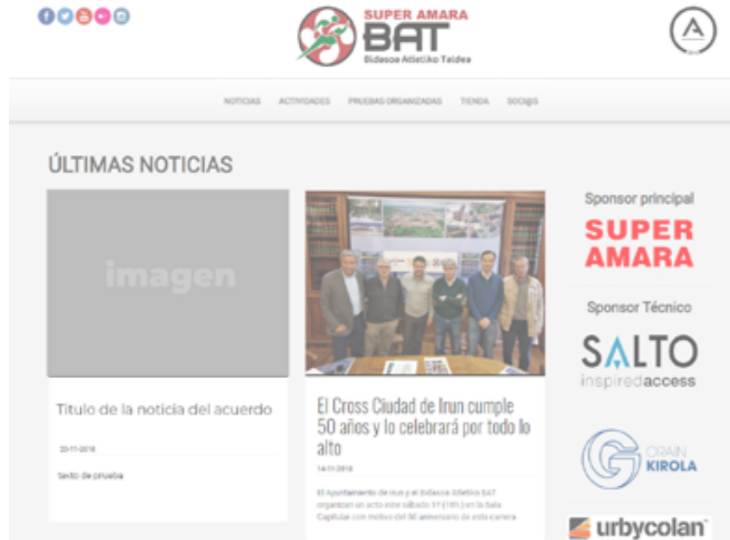
(Ejemplo tarjeta permanente)

Una vez cerrado el acuerdo, el club iniciará acciones de comunicación en sus principales canales. La primera de ellas, la creación y publicación de una noticia en la web oficial del club, celebrando el acuerdo y dando información comercial de la empresa.