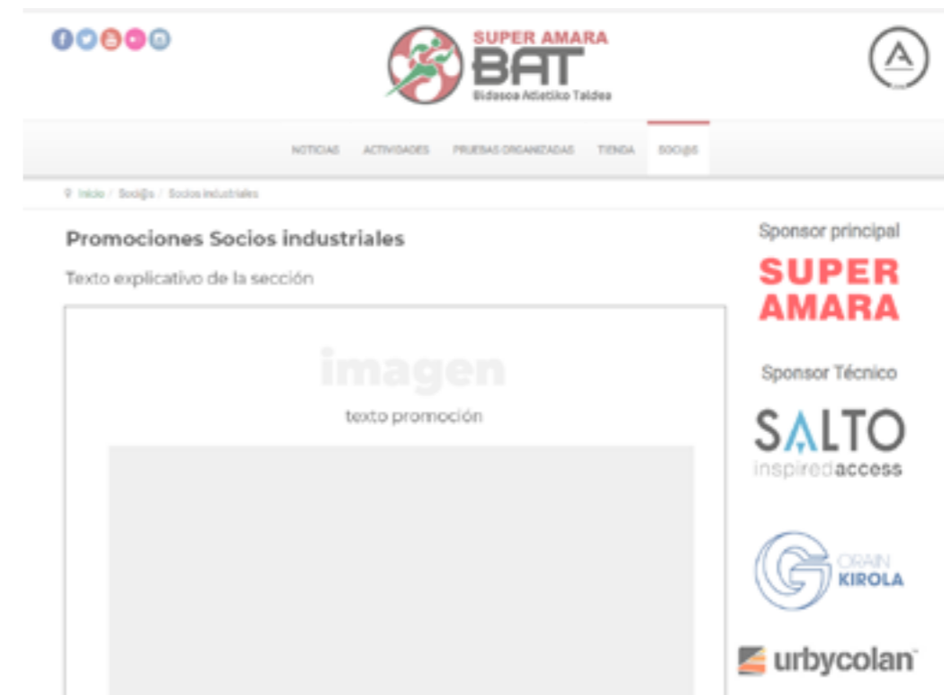
(Ejemplo tarjeta permanente)

Otro sistema de control podría ser el reparto de códigos específicos por email.